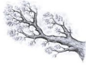
Branches ou feuilles d'arbres